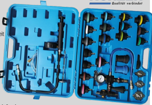
Kühlerabdruck-Satz für PKW + LLKW, 28-tlg. 7KVD 28.1